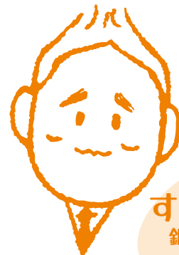
すぎむら 釧路支店