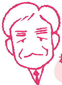
わきざわ 函館支店