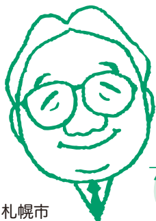
やまだ プロパティマネジメント 事業部