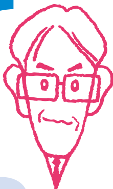
なかむら ソリューション営業部